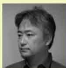
城本建築設計事務所 / 城本 章広