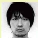
n h a / 西本 寛史